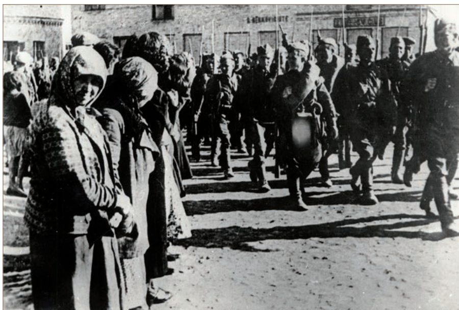
Raudonosios armijos daliniai žygiuoja per Eišiškes. 1940 m. birželio 15 d.