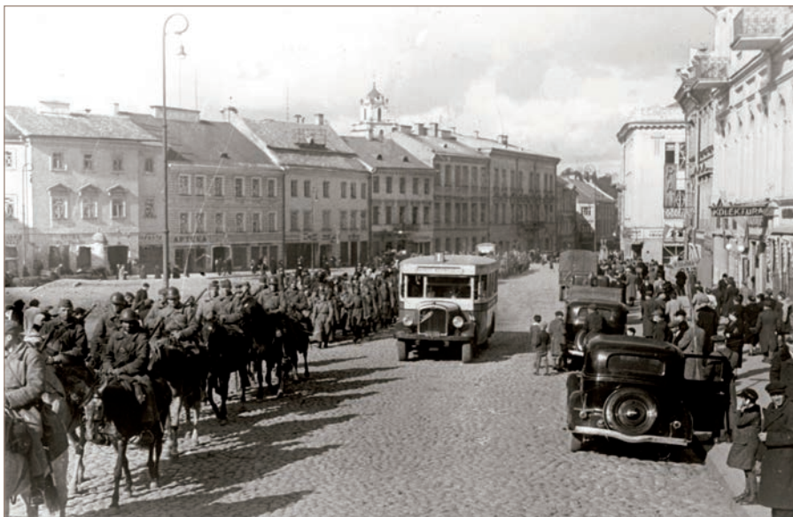
Raudonosios armijos karių kolona Vilniuje. 1939 m. rugsėjo mėn.

visos jos gerokai išgąsdintos. 1939 m. rugsėjo mėn. pabaigoje Baltijos šalių pasienyje Sovietų Sąjungos buvo sutelkta 437 235 kariai, 3 052 tankai ir 3 635 artilerijos pabūklai.