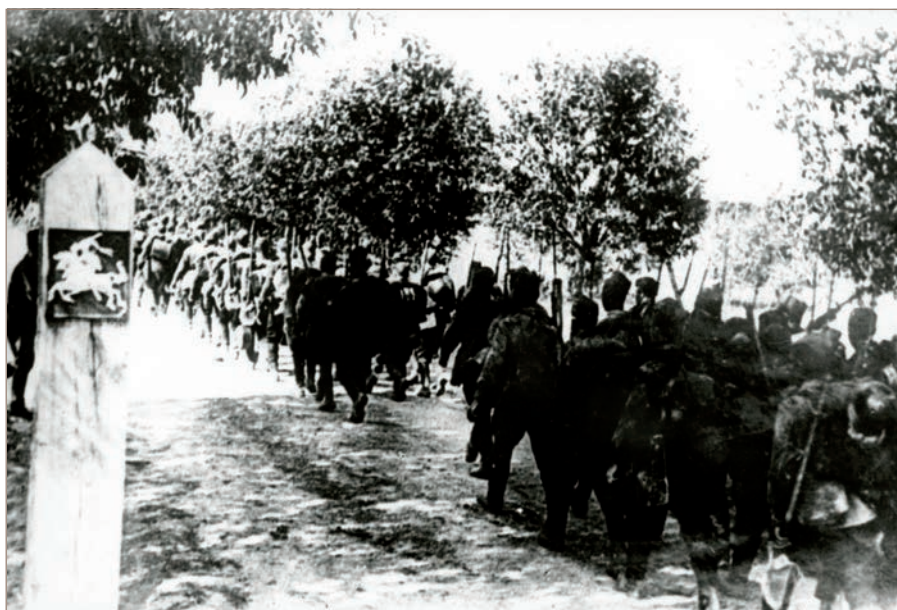
Raudonosios armijos kariai kerta SSRS-Lietuvos sieną, 1940 m. birželio 15 d.

Kremliaus tuometinės ekspansinės politikos gairės aiškiai atskleistos Raudonosios armijos politinės valdybos direktyvoje Nr. 5258ss: „Mūsų užduotis aiški. Mes norime užtikrinti SSRS saugumą, stiprių užraktu uždaryti iš jūros priėjimus prie Leningrado, mūsų šiaurės–rytų sienas. Per Estijos, Latvijos ir Lietuvos antiliaudiškų klikų galvas mes įvykdysime mūsų istorinius uždavinius ir kartu padėsime šių šalių darbo liaudžiai išsivaduoti. (...) Lietuva, Estija ir Latvija taps sovietiniu forpostu ant mūsų jūrų ir sausumos sienų. Pasiruošimas puolimui turi būti visiškoje paslapyje. (...) Reikės greitai suardyti priešą armiją, demoralizuoti užnugarį ir tokiu būdu padėti Raudonosios armijos vadovybei per trumpiausią laiką ir su mažiausiomis aukomis pasiekti visiškos pergalės“.