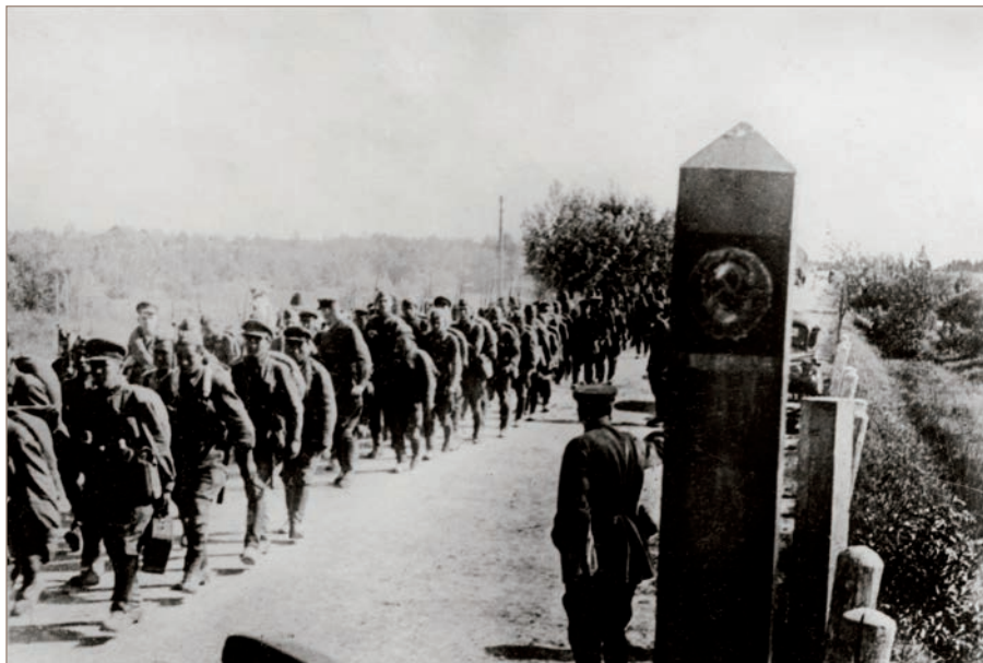
Raudonosios armijos kariai kerta SSRS-Lietuvos sieną. 1940 m. birželio 15 d.