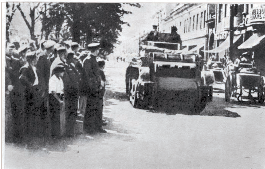
Okupacinė kariuomenė įžengia į Kauną. 1940 m. birželio 15 d.

Baltijos šalių 1940 metų patyrimas yra rimta pamoka. Atsižvelgiant į tai, Rusijos veiksmai Ukrainoje 2014 metais – tai rimtas ir pavojingas tarptautinės teisės pažeidimas. Rusija, aneksuodama Krymą, telkdama kariuomenę prie Ukrainos sienų, pakenkė ne tik Ukrainai, bet ir tarptautinių susitarimų sistemai. Europos Parlamentas pažymėjo, kad „Rusijos tvirtinimas, kad ji turi teisę naudoti visas priemones siekdama apsaugoti rusų mažumas trečiosiose šalyse (...) neatitinka tarptautinės teisės nuostatų ir pažeidžia pagrindinius tarptautinės elgsenos XXI a. principus, taip pat kelia grėsmę pokarinei tvarkai Europoje. Pasak Kolumbijos universiteto ekonomikos profesoriaus Jeffrey D. Sachso, jeigu Rusija nepakeis savo politikos, turėtume sulaukti itin rimtų pasaulinių padarinių, tarptautiniai santykiai taps dar labiau įtempti ir persmelkti nacionalizmo. Klaida iš vienos ar kitos pusės gali privesti prie tragiško karo. Žvilgtelėję į praėjusius šimtą metų iki Pirmojo pasaulinio karo pradžios, visada rasime įrodymų, kad vienintelis būdas užtikrinti saugumą pasaulyje yra tarptautinė teisė, kurią palaiko Jungtinės Tautos ir kurią gerbia visos šalys.